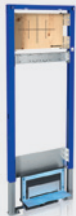
Montážny prvok Duofix pre sprchy s odtokom v stene pre armatúry na omietku alebo pod omietku