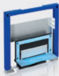
Montážny prvok Duofix pre sprchy s odtokom v stene

Použitie: na zabudovanie do čiastočne vysokej steny alebo steny na celú výšku miestnosti, suchým procesom do ľahkej priečky