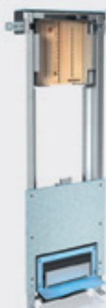
Montážny prvok Uniflex pre sprchy s odtokom v stene pre murované konštrukcie

Použitie: na zabudovanie do čiastočne vysokej steny alebo steny na celú výšku miestnosti, suchým procesom do ľahkej priečky